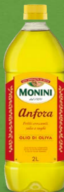
Pet 2 Lt