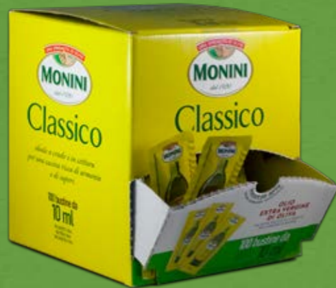
100 bustine da 10 ml

L'innovativo tappo dosatore assicura un uso preciso, pulito e senza sprechi.