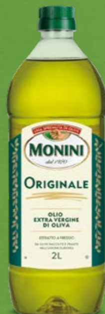
Pet 2 Lt