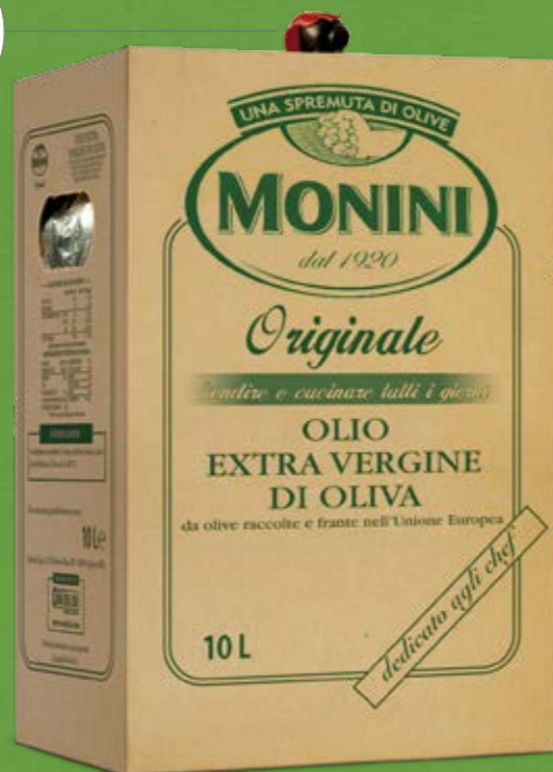
Bag in Box 10 Lt

La bottiglia in PET da 2 litri permette un uso comodo e sicuro del prodotto in cucina.