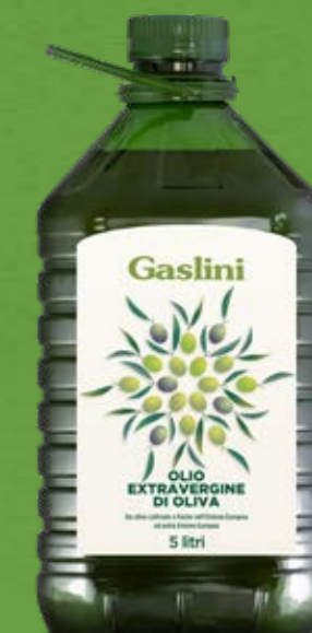
Pet 5 Lt

Le bottiglie in PET garantiscono un'ottima conservazione del prodotto e tutta la praticità di un formato ingfrangibile e leggero.