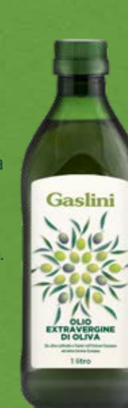
Pet 1 Lt

Per tutti gli usi, sia a crudo che per cucinare.